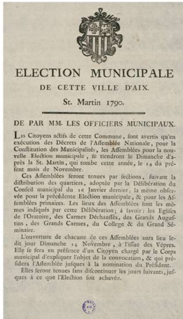
Affiche annonçant la première élection municipale aixoise, 1790 (cote LL310) Archives municipales Aix-en-Provence

Librement communicables, les dossiers électoraux, et notamment les procès-verbaux, constituent une source importante pour étudier les évolutions politiques d'une commune. Les listes électorales quant à elles sont très précieuses pour les généalogistes qui peuvent ainsi retracer le parcours d'un individu au gré de son passage dans la commune. Toutefois, les registres de listes électorales conservés aux Archives municipales ne peuvent être consultés qu'après une période de 50 ans suivant leur clôture (respect de la vie privée).